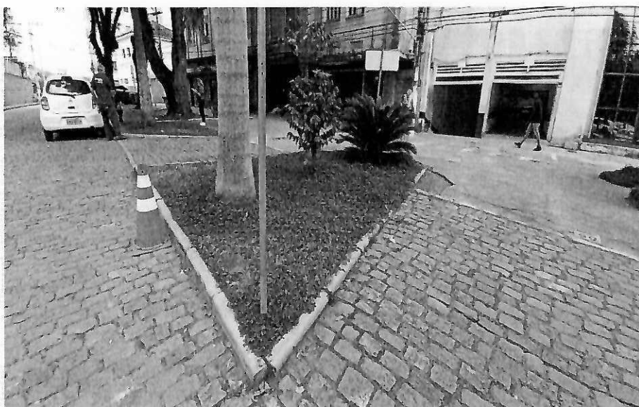
Canteiro 3 - Calçada medindo 6,53m (C) x 5,37m (L)