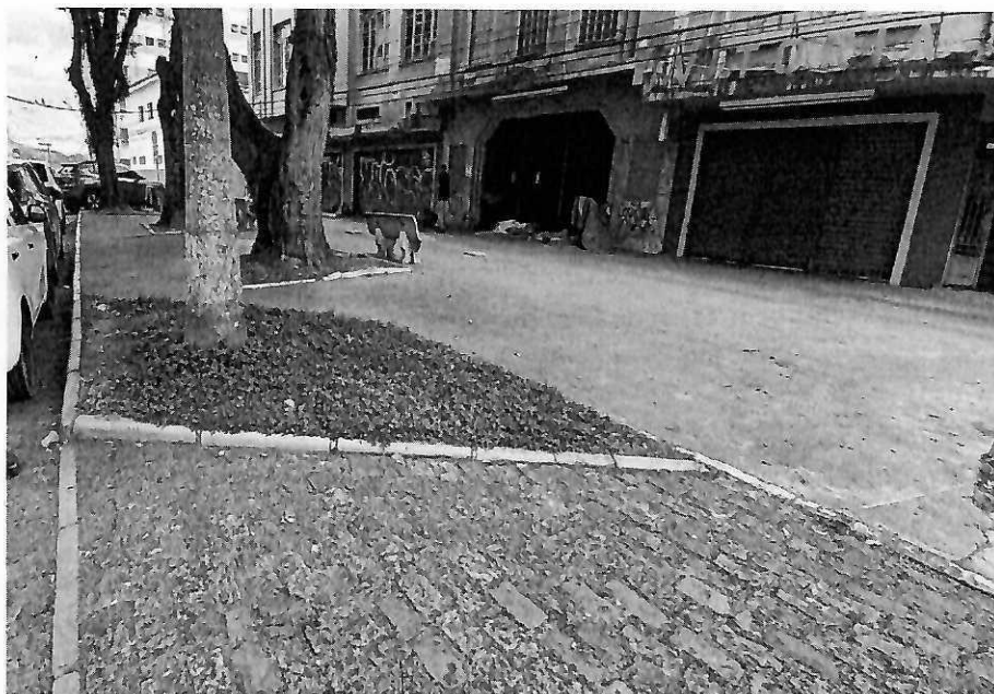
Canteiro 4 – Calçada medindo 3,78m (C) x 5,73m (L)