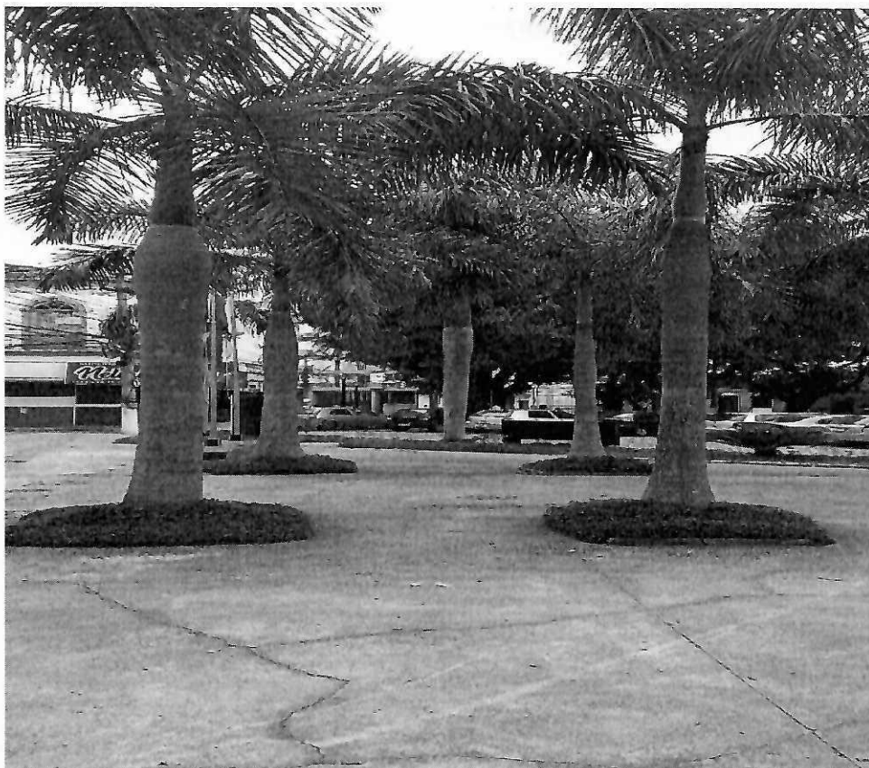
10 árvores palmeiras imperiais com canteiros de grama medindo: 1,30m (C) x 1,60m (L)