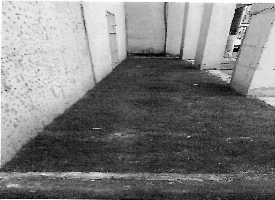
Lateral - Medida: 8,14m (C) x 1,40m (L)