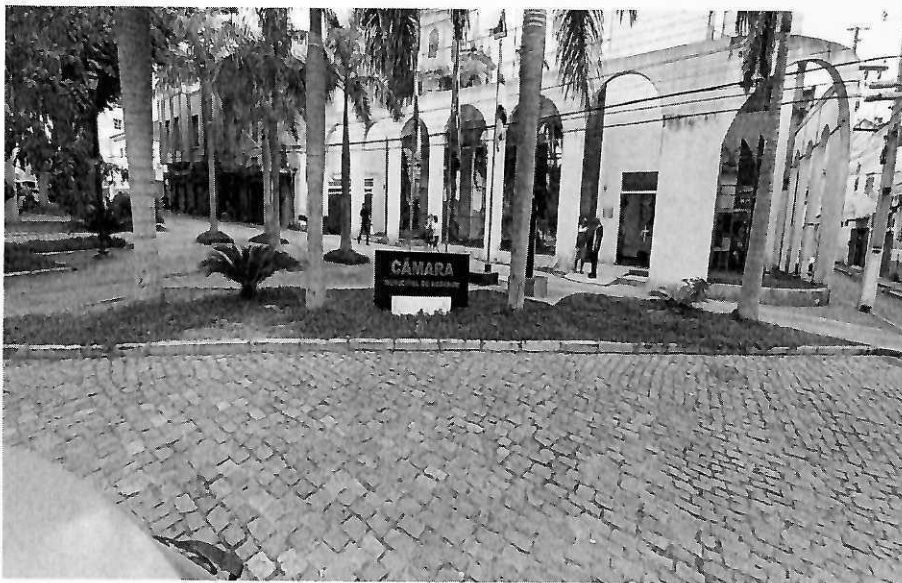
Canteiro 1 – Calçada medindo 19,00m (C) x 3,80m (L)