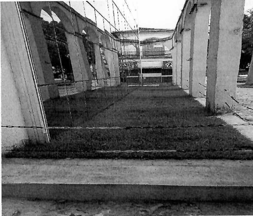
Frente - Medida: 14,20m (C) x 1,60m (L)