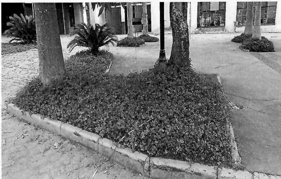
Canteiro 2 – Calçada medindo 4,24m (C) x 3,34m (L)